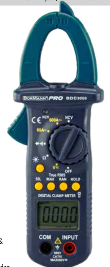
Συσκ. 20τμχ | M13xΠ23xY5cm | 0.4Kg