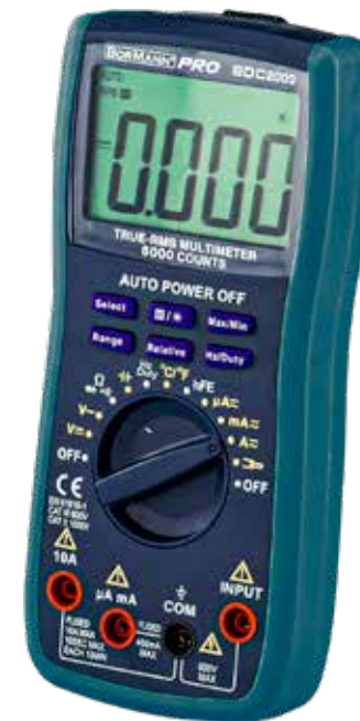
Συσκ. 20τμχ | M36xΠ30xY45.5cm | 0.6Kg