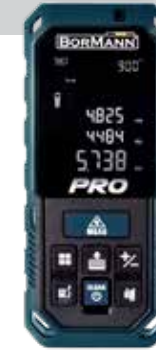
Συσκ. 20τμχ | M14.5xΠ15.5xY5cm | 0.3Kg