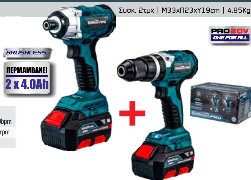
Συσκ. 2τμχ | M33xΠ23xY19cm | 4.85Kg