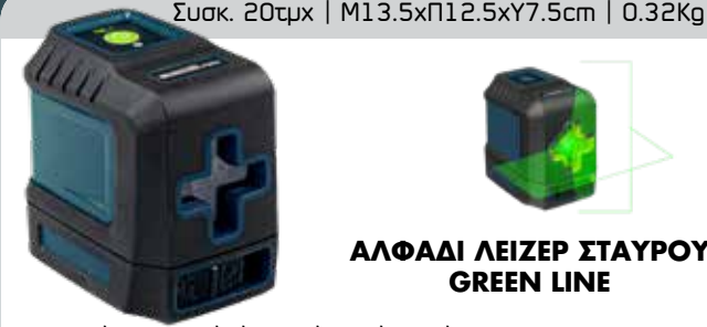
Συσκ. 20τμχ | M13.5xΠ12.5xY7.5cm | 0.32Kg